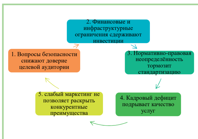
Рисунок 1 – Модель причинно-следственных связей в системе ограничений развития оздоровительного туризма

Только системная работа по всем направлениям способна трансформировать существующие ограничения в возможности для устойчивого роста санаторно-курортной отрасли Камеруна.