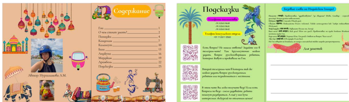
Рисунок 1 – Форзац и заключительная внутренняя сторона путеводителя

Структура путеводителя была сформирована с учетом потребностей целевой аудитории, с целью обеспечения максимальной информативности, удобства навигации и создания целостного представления о регионе. Путеводитель состоит из следующих основных разделов: обложка; форзац; раздел «Гоа» с подробной информацией про штат; информация для туристов «О чем стоит знать?»; описание популярных туристических центров штата, а также заключающая сторона путеводителя (рисунок 1).