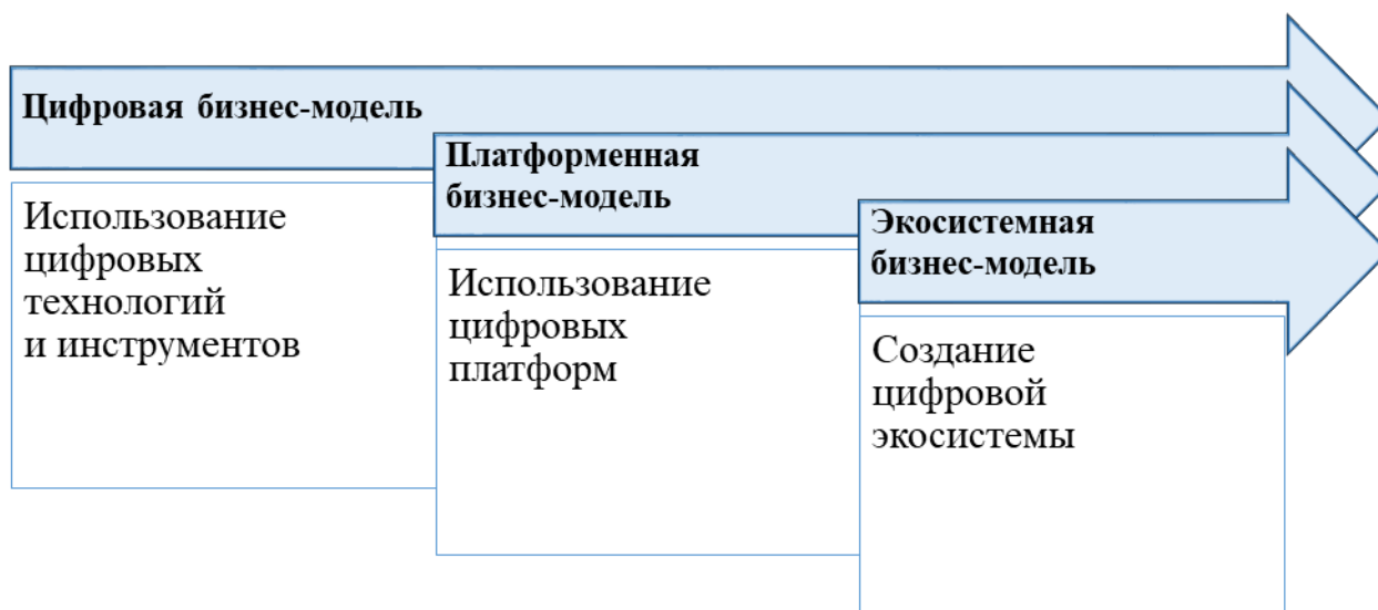
Рисунок 2 – Развитие цифровых бизнес-моделей в гостиничной индустрии

Эволюция цифровых бизнес-моделей осуществляется последовательно и включает три ключевые стадии: этап освоения и имплементации базовых технологий, фазу их платформенной интеграции и заключительную стадию формирования эффективного взаимодействия в рамках целостной экосистемы (рисунок 2).